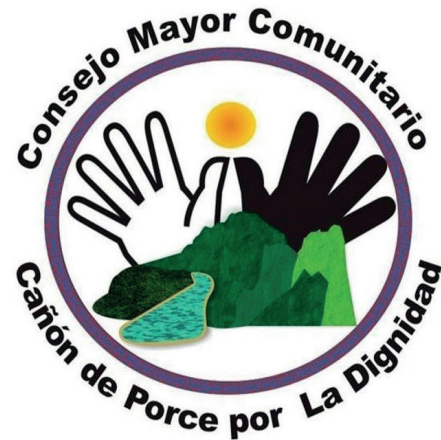
▲ Imagen 1 Logo CMC

La organización se pensó con un radio de acción de tres municipios, se decidió que las reuniones se desarrollarían en diferentes sitios del territorio, el proceso se haría caminando, para que así “nos fuéramos integrando más”; además, era fundamental que todos reconocieran que “el río nos une, en vez de separarnos, porque allí trabajamos, interactúan”, lo mismo las montañas, “nos unen porque compartimos la misma biodiversidad”, y