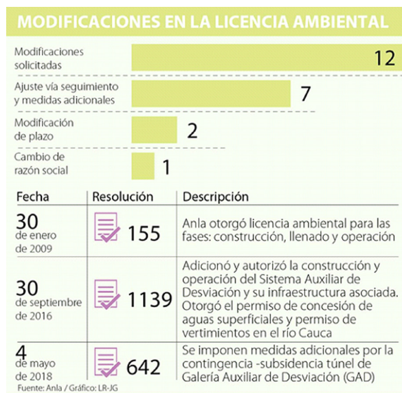
Ilustración 6. Resumen de las modificaciones a la licencia ambiental. (La República, 2018)

Otro punto a analizar es que el proyecto Hidroituango obedece a decisiones políticas por encima de las técnicas, comportamiento típico de la plutocracia, es decir, que el poder se ejerce desde los más ricos o muy influido por ellos. Para muestra es que la licencia ambiental tiene 22 modificaciones tal como se resume el siguiente infográfico: