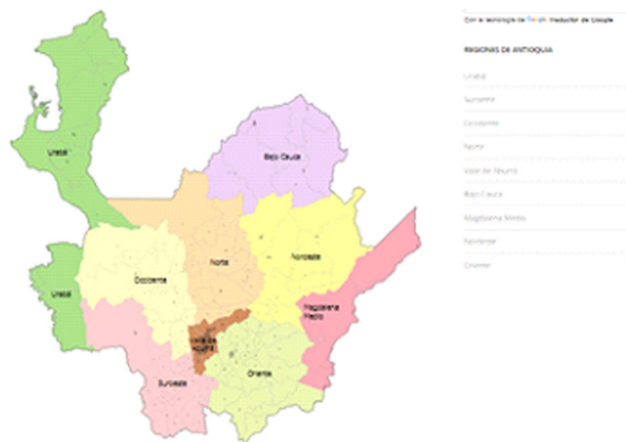
Ilustración 2. Distribución en subregiones de Antioquia.

Adicionalmente, con el fin de establecer una “mejor coordinación institucional” en la gestión pública se ha propuesto organizar el Departamento en nueve subregiones: bajo cauca, Magdalena Medio, Nordeste, Norte, Occidente, Oriente, Suroeste, Urabá y Valle de Aburrá. En la siguiente ilustración se muestra su distribución: