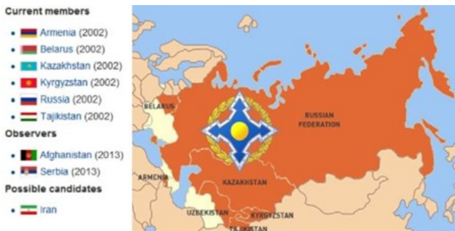
Geo referenciación de la Organización del Tratado de la Seguridad Colectiva (OTSC). Tomado de https://abcblogs.abc.es/jorge-cachinero/otros-temas/30-anos-de-la-organizacion-del-tratado-de-seguridad-colectiva-otsc.html?ref=https%3A%2F%2Fwww.google.com%2F

A este bloque político-militar y sus intentos por cerrar el paso al avance geopolítico de las Relaciones Internacionales de Rusia, se mantiene un organismo heredero del Pacto de Varsovia que se denomina la Organización del Tratado de la Seguridad Colectiva (OTSC) integrado por Rusia y 5 Estados más 1 . Esta organización militar, liderada por Rusia, plantea como objetivos fortalecer la paz, la seguridad y la estabilidad en el espacio postsoviético (Delgado, 2022). Este tratado cumple 30 años en 2022 desde su definición de permanencia.