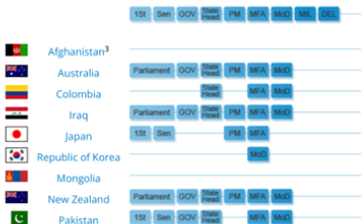
Nivel partnership Colombia.

La gráfica a continuación relaciona los entes estatales que promovieron el Acuerdo, Cabeza de Estado (Presidencia de la República) ii , Ministerio de Relaciones Exteriores iii (Cancillería de Colombia) y Ministerio de Defensa iv .