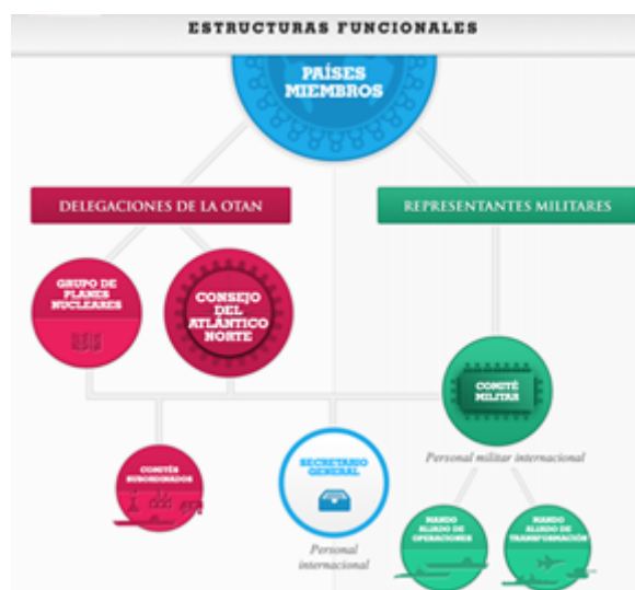
Estructura de la OTAN.

El Comité Militar, que depende del Consejo y el Grupo de Planes Nucleares, dividido en Mando Aliado de Operaciones y de Transformación, opera las decisiones políticas que tienen implicaciones militares. Este organismo lo componen los Jefes de Estado Mayor de Defensa; el personal militar internacional, el cuerpo ejecutivo del Comité Militar y la estructura de mandos militares. La OTAN no tiene fuerzas propias o permanentes, por ello cuando se inicia una operación, los miembros contribuyen con fuerzas militares de forma voluntaria, fuerzas que regresan al cumplir el objetivo (OTAN, 2022).