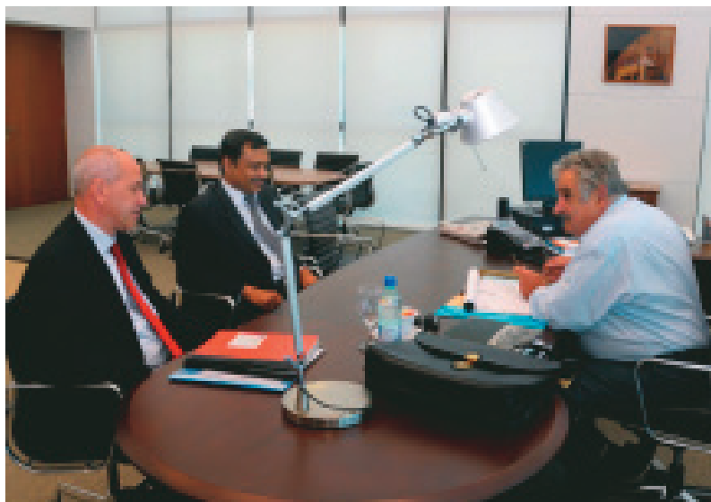
Figura 1. Extractivismos distintos (progresistas y conservadores reajustados), pero compartiendo una misma base común en sus concepciones del desarrollo. Uruguay: José “Pepe” Mujica recibe al CEO de la empresa minera junior Zamin Ferrous, junto al director de su proyecto de explotar hierro en Uruguay, Montevideo 2010.