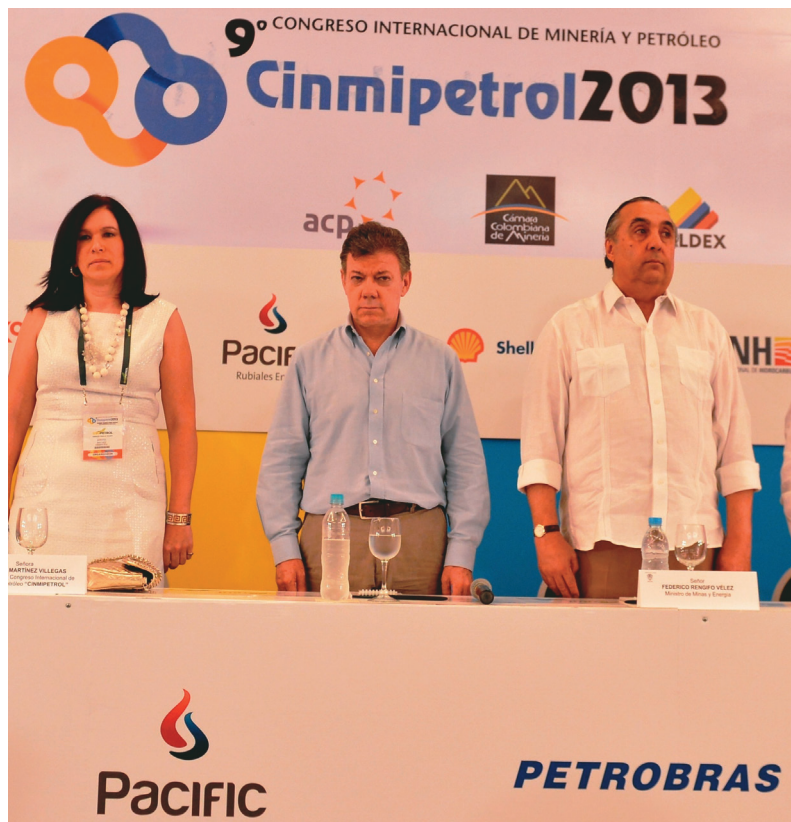
Colombia: J.M. Santos defendiendo la “locomotora minera” junto a autoridades y empresarios en el congreso de la minería y el petróleo 2013.

Los movimientos sociales se han dado cuenta de esto. Ellos padecen los efectos locales de esos emprendimientos, y son igualmente dañinos si están en manos de una corporación del hemisferio que si se deben a