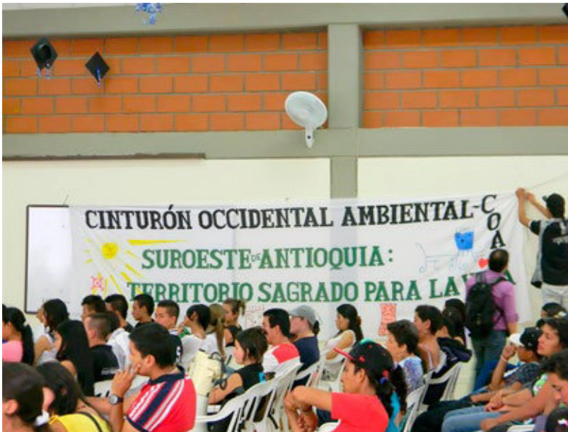
COA presente en el Cabildo Abierto en Ciudad Bolívar