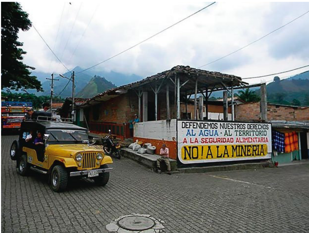
Corregimiento de San Bernardo de los Farallones. Ciudad Bolívar